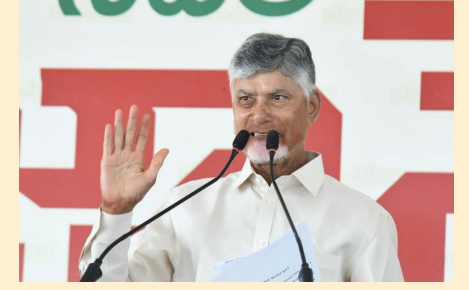
వికంగా రూ.19,305 కోట్లు కేటాయించామని తెలిపారు. యూనివర్సల్ హెల్త్ పాలసీ ద్వారా

మహిళల్లో అత్యధికంగా వస్తున్న సర్వైకల్ క్యాన్సర్ ను అరికట్టేందుకు 15 ఏళ్లలోపు బాలికలకు హెచ్పీవీ టీకాలను ఉచితంగా అందిస్తున్నట్లు చంద్రబాబు వెల్లడించారు. బయట మార్కెట్లో రూ.4 వేలు ఉండే ఈ టీకాను, రాష్ట్రంలోని 3.45 లక్షల మంది బాలికలకు ఉచితంగా అందించేందుకు రూ.14.11 కోట్లు ఖర్చు చేస్తున్నామన్నారు. కర్నూలులో రూ.50 కోట్లతో స్టేట్ క్యాన్సర్ ఇన్స్టిట్యూట్ ఏర్పాటు చేస్తున్నామని, తాజా బడ్జెట్లో వైద్య రంగానికి